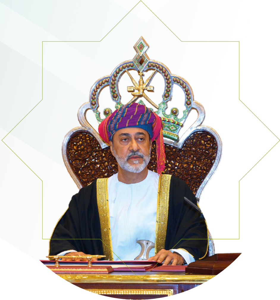
حضرة صاحب الجلالة السلطان هيثم بن طارق المعظم - حفظه الله ورعاه -